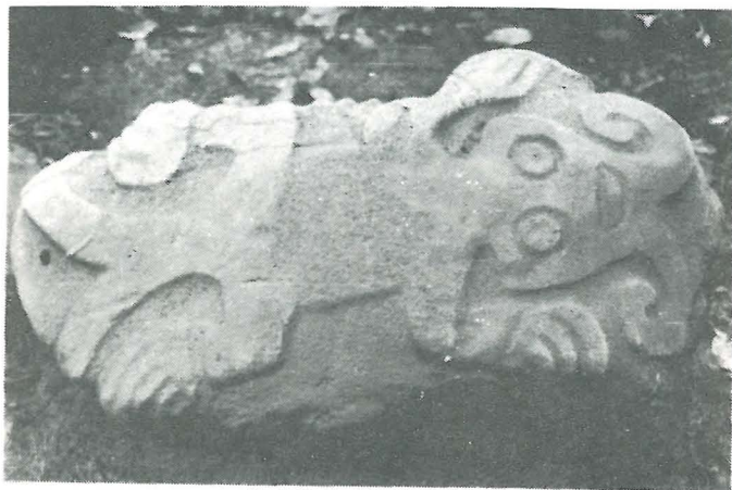
Petroglifo No. 2, Categoria D