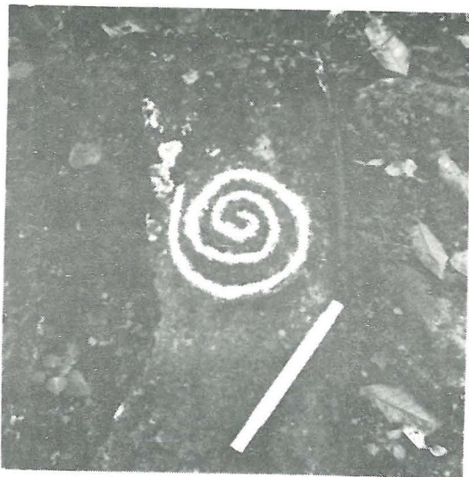
Petroglifo No. 34, Categoria A1