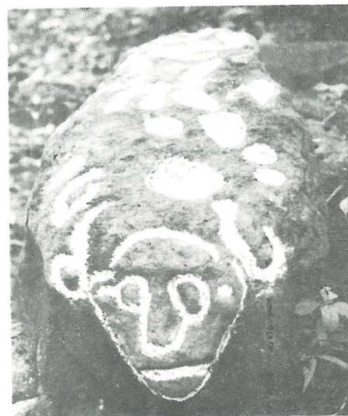
Petroglifo No. 3, Categoria F