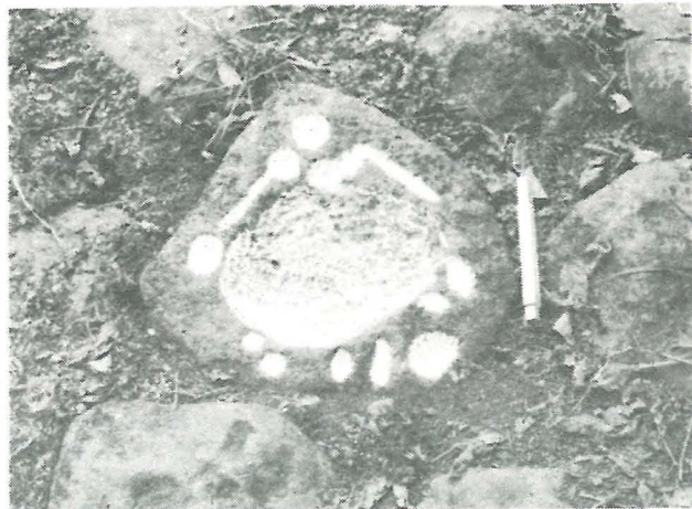
Petroglifo No. 23, Categoria E