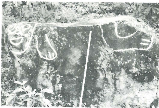
Petroglifo No. 1, Categoria D