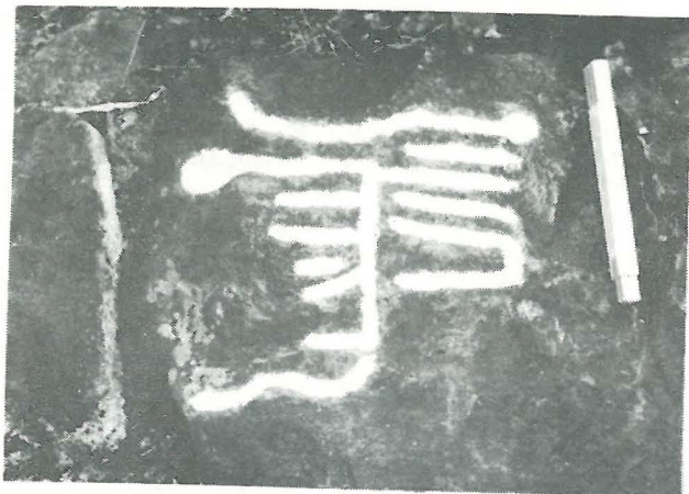
Petroglifo No. 31, Categoría B1