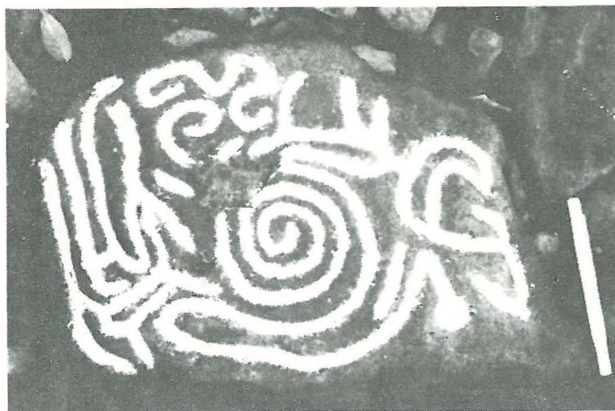
Petroglifo No. 6, Categoria A2