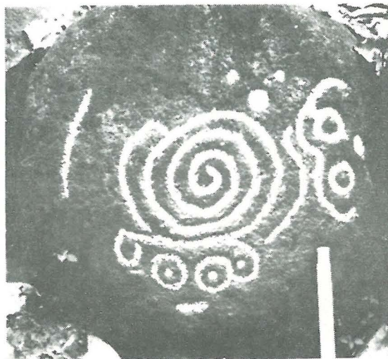
Petroglifo No. 4, Categoria A2