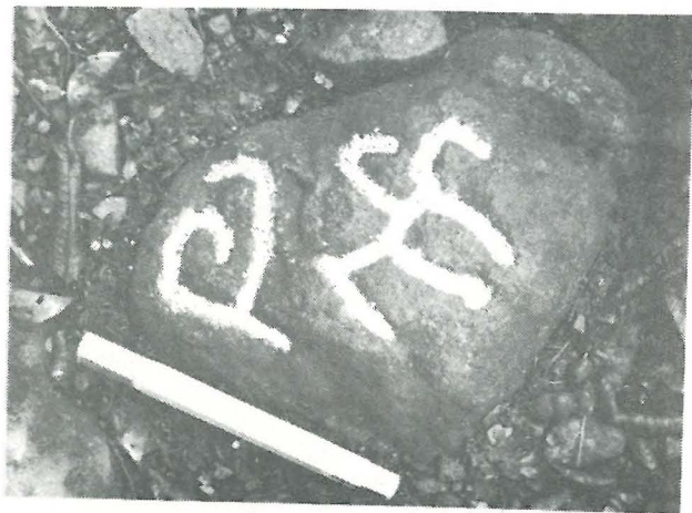
Petroglifo No. 32, Categoría B2