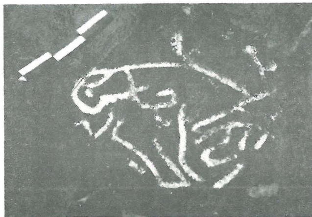
Petroglifo No. 14, Categoría C