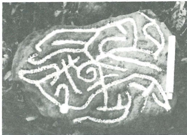
Petroglifo No. 25, Categoría C