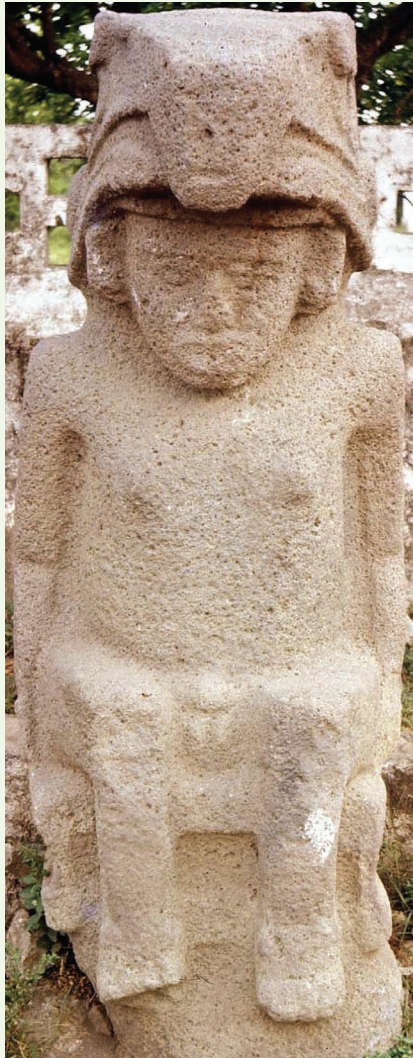
Escultura N° 228 de Ometepe. Esta es la estatua mejor conservada de Nicaragua; se encuentra sin protección en el atrio de la iglesia de Altagracia. Altura +181 cm. Foto de Claude Baudez 1960.

Convento San Francisco de Granada, pero el esfuerzo por estudiar y garantizar que el corpus general de esculturas siga atravesando los siglos apenas comienza.