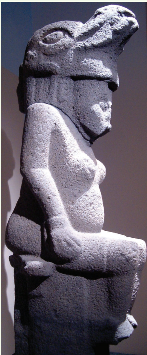
Escultura N° 214, Figura femenina con un tocado en forma de ave rapaz. Pertenece al Museo Nacional de Nicaragua. En el Museo de Louvre de París del 2001-2008. Altura 220 cm.

pesar de la negatividad tejida alrededor de dichas imágenes, algunas esculturas han logrado llegar hasta nosotros, ellas permiten rescatar el recuerdo y dar realce al arte en piedra de nuestros aborígenes, fortaleciendo nuestra identidad cultural.