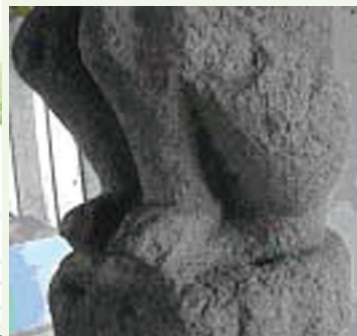
Escultura N° 115 de Punta de las Figuras. Es una figura de hombre en cuclillas con joroba y un círculo inciso en el abdomen. La zona señalada es el área de obtención del pigmento rojo. Localización Museo San Francisco, Granada, Altura + 163 cm.