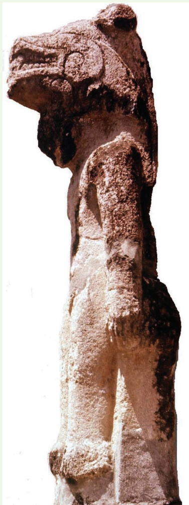
Escultura N° 44 de Sonzapote, isla Zapatera. Hombre con un gran tocado de felino. Localización convento San Francisco, Granada. Altura + 222 cm.

Durante la conquista y la colonia, las estatuas fueron derribadas de sus lugares de instalación, quebradas y luego olvidadas. El respeto y la veneración que ellas inspiraron, se reemplazó por un sentimiento de desprecio, inculcado a los vencidos y a sus descendientes. A