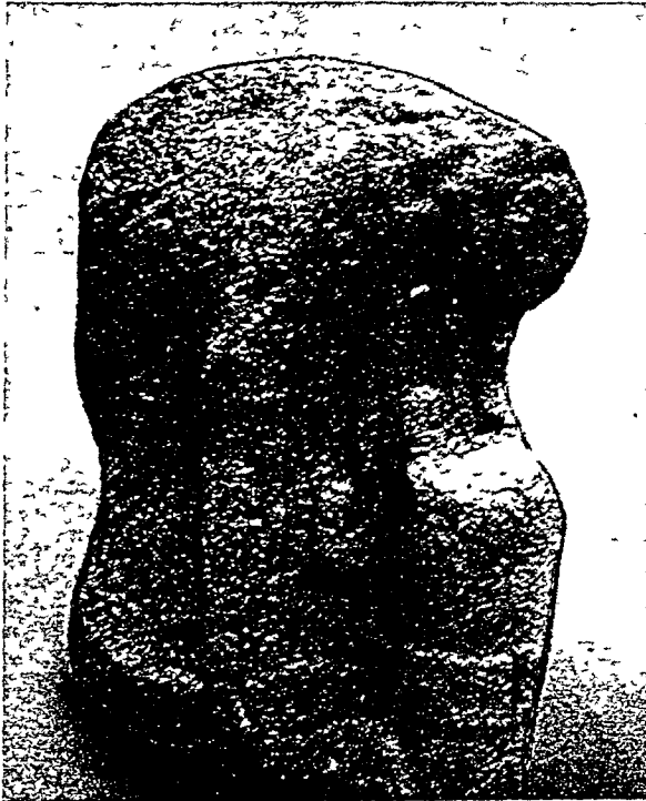
Fig. 4 Alta Gracia, 'Idolo' 6, visto por un lado.

estatuas mexicanas, desde la época de Teotihuacán (vg. la llamada «Diosa del Agua», Vaillant 1950, pl. 24) hasta la era de los Azteca (vg. las estatuas del Castillo de Teayo, Seler 1908 [1904], pp. 410-49). Los mismos elementos aparecen en numerosas figurillas de cerámica, también desde el tiempo de Teotihuacán hasta aquel de la conquista. Es un espacio de tiempo bastante amplio, por consiguiente, y demasiado largo para comparaciones exactas. Además, estas comparaciones no valen mucho, mientras no se encuentren más hallazgos intermedios, que puedan ayudar a unir las dos regiones y a determinar el tiempo preciso de la eventual llegada de estos elementos a Nicaragua.