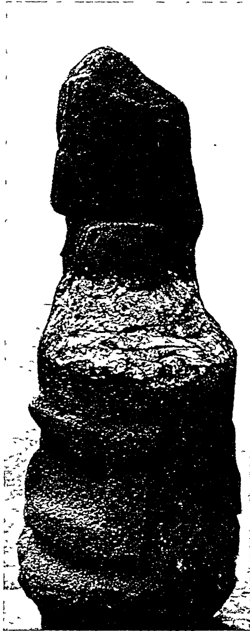
Fig 2. Alta Gracia, 'Idolo' 2 A, visto por un lado