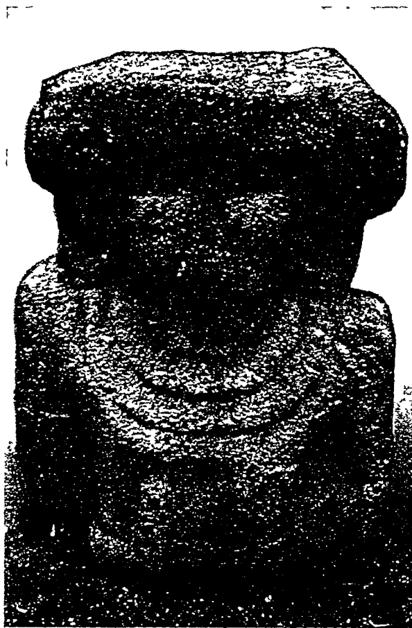
Fig 3 Alta Gracia, 'Idolo' 6, visto por delante

es la posición del brazo izquierdo de A. G. 6 y el bastón que lleva en la mano; un detalle semejante al estilo «del Pacífico» es el «velo» trasero, que aparece también en aquel grupo, por ejemplo en una estatua de Zapatera publicada por Bovallius (1886, lám. 18, de frente), que se encuentra ahora en la magnífica colección del Colegio Centro-América en Granada, Nicaragua.