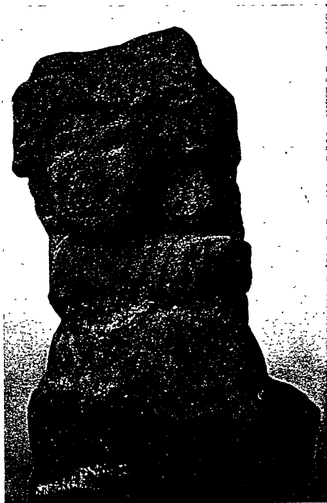
Fig. 1. Alta Gracia, 'Idolo' 2 A, visto por delante.